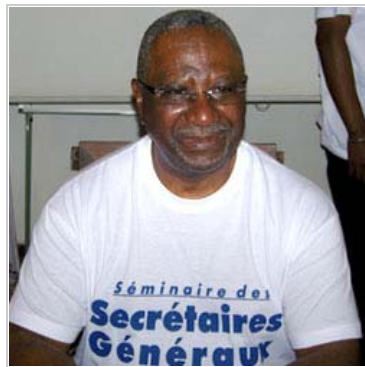
Le Secrétaire général de la Primature, Yves O'wanlele, le 14 novembre à la Pointe Denis