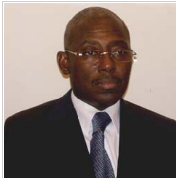
Le ministre gabonais de l'Intérieur, Jean François Ndongou

Il faut dire que si nous avons pris par le passé, l'habitude de mettre l'homme qu'il faut à la place qu'il faut, on ne serait pas là à organiser des séminaires de ce genre. Nous avons des technocrates sortis des grandes écoles telles que l'ENA qui sont censés occuper ces fonctions et bien d'autres. Mais non, on fait toujours dans